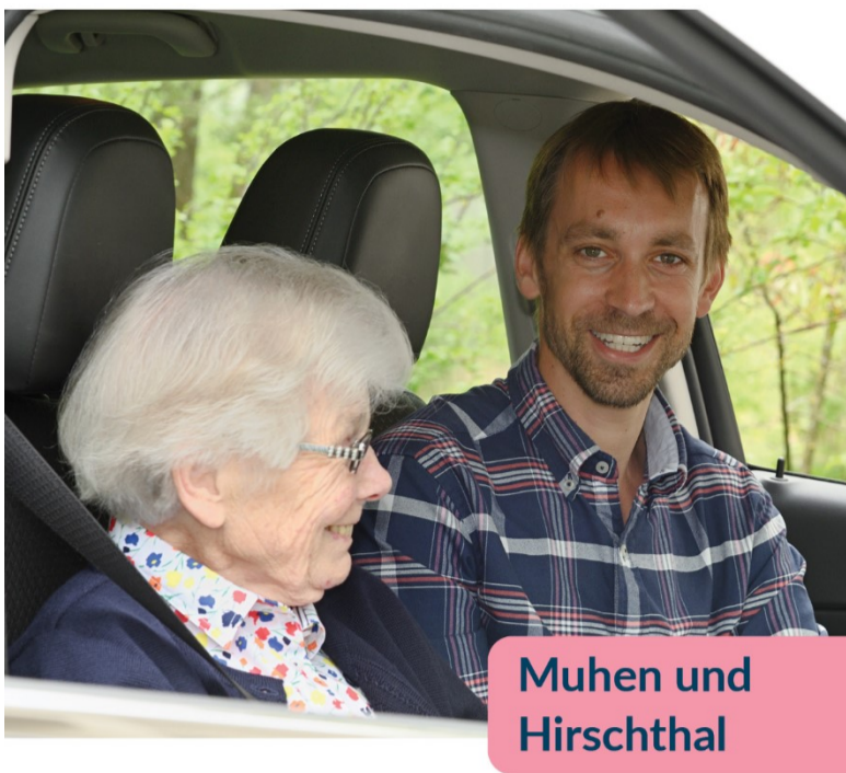
Muhen und Hirschthal

Der Fahrdienst für Personen mit Mobilitätseinschränkungen