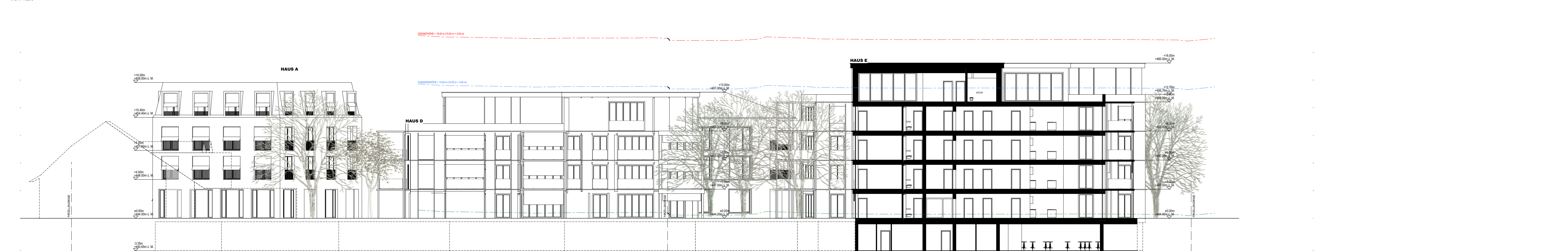
07.04 QUERSCHNITT HAUS E