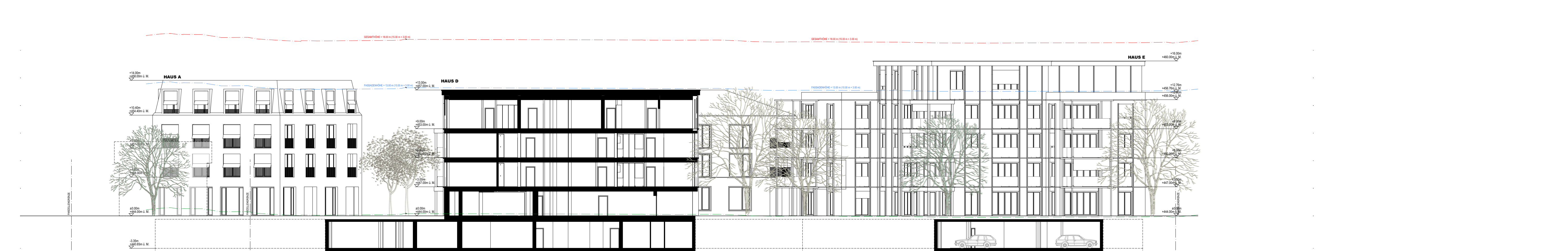
07.03 QUERSCHNITT HAUS D