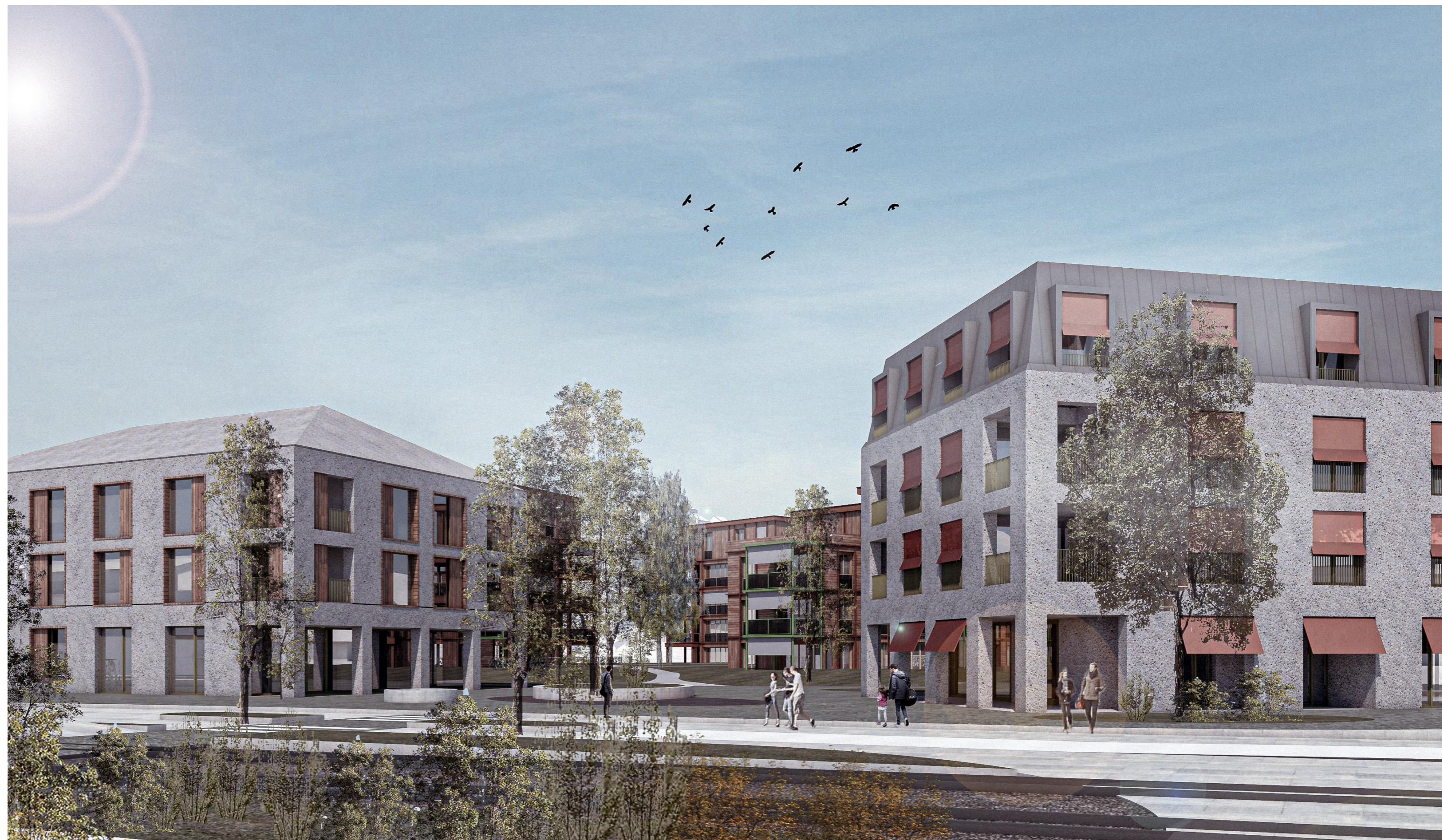
1. BAUREIHE MIT HAUS A UND B= AZ 1.016